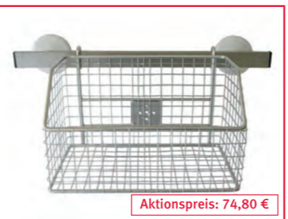
Aktionspreis: 74,80 € Korb mit Eingriffschräge, H x B x T: 160 x 250 x 150 mm Art.-Nr.: 10 30 907