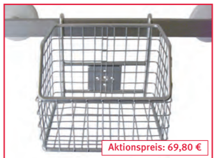
Aktionspreis: 69,80 € Korb mit Eingriffschräge, H x B x T: 150 x 140 x 130 mm Art.-Nr.: 10 30 909