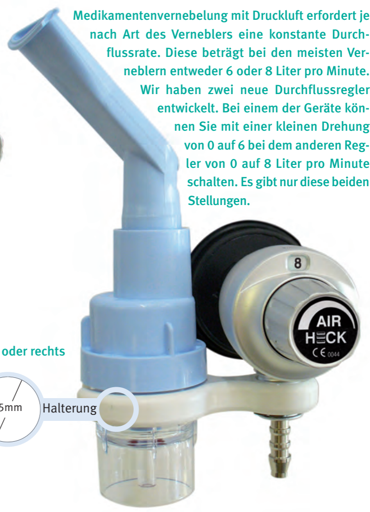
Medikamentenvernebelung mit Druckluft erfordert je nach Art des Verneblers eine konstante Durchflussrate. Diese beträgt bei den meisten Verneblern entweder 6 oder 8 Liter pro Minute. Wir haben zwei neue Durchflussregler entwickelt. Bei einem der Geräte können Sie mit einer kleinen Drehung von 0 auf 6 bei dem anderen Regler von 0 auf 8 Liter pro Minute schalten. Es gibt nur diese beiden Stellungen.

Besuchen Sie uns auf der Medica oder im Internet unter www.heckmed.de