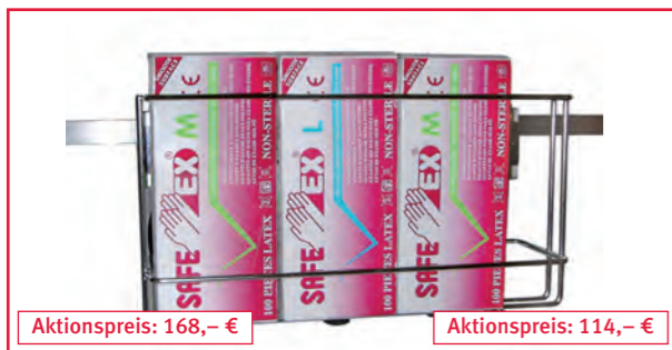
Aktionspreis: 168,- € Aktionspreis: 114,- € Halter für 3 Handschuhkartons mit zwei Schienenhaltern Art.-Nr.: 10 30 712