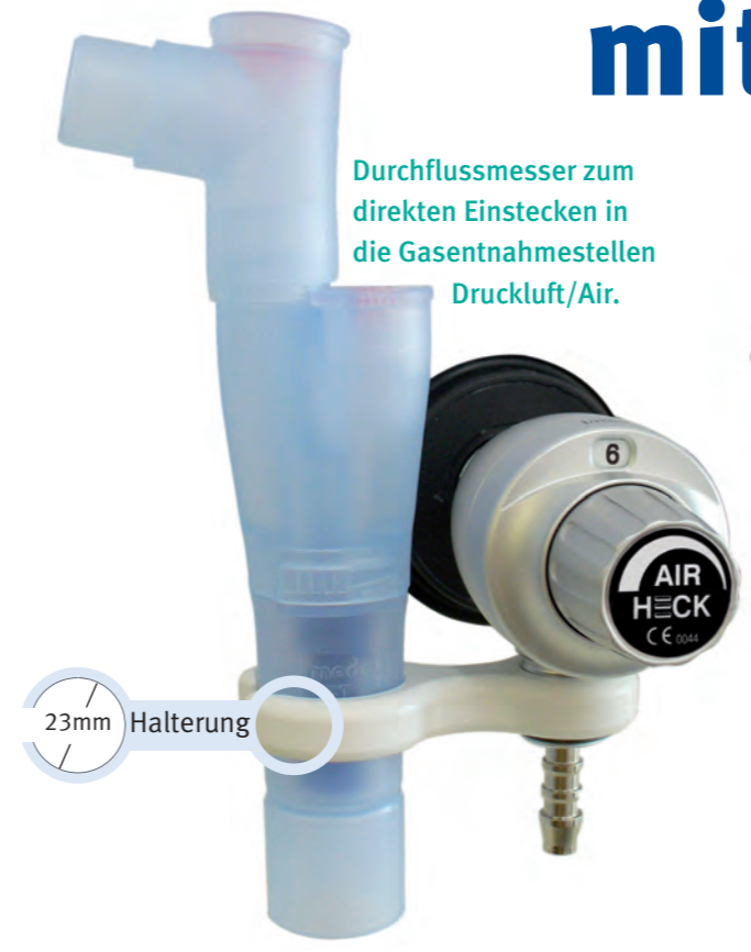
Durchflussmesser zum direkten Einstecken in die Gasentnahmestellen Druckluft/Air. Halterungen für verschiedene Medikamentenvernebler