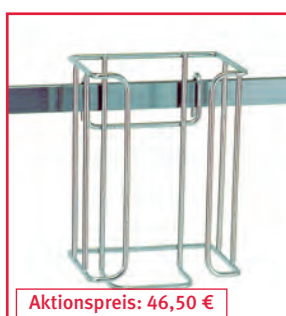
Aktionspreis: 46,50 € Handschuhhalter mit zwei Haken zur Schienenbefestigung Art.-Nr.: 10 10 958