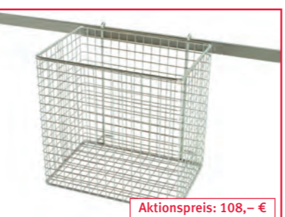
Aktionspreis: 108,- € Korb mit zwei Haken, H x B x T: 300 x 300 x 200 mm Art.-Nr.: 10 40 303