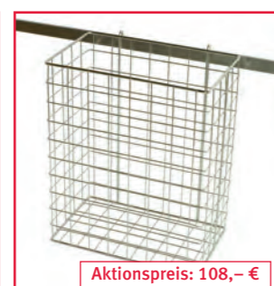
Aktionspreis: 108,- € Korb mit zwei Haken, H x B x T: 390 x 300 x 200 mm Art.-Nr.: 10 40 301