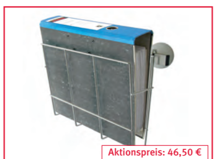
Aktionspreis: 46,50 € Halter für DIN A 4 Ordner zur Schienenbefestigung Art.-Nr.: 10 30 903